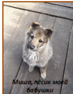
Миша, пёсик моей бабушки