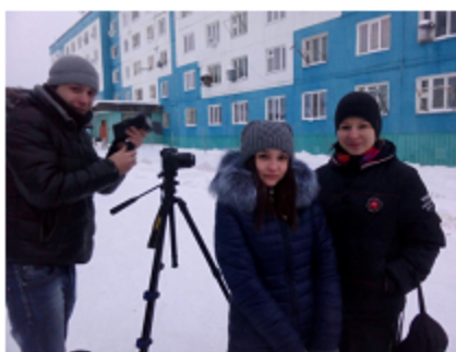
автор: М. Рукосуева, А. Реутова

граждане, со своими бедами и проблемами.